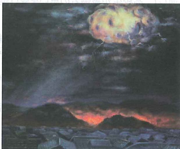
「ヒロシマの最も長い夜(地獄の炎ときのご雲の残塊)」